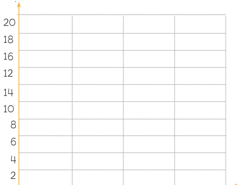
Pembe Mor Yeşil Mavi